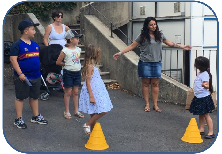
Kermesse en Juin 2019