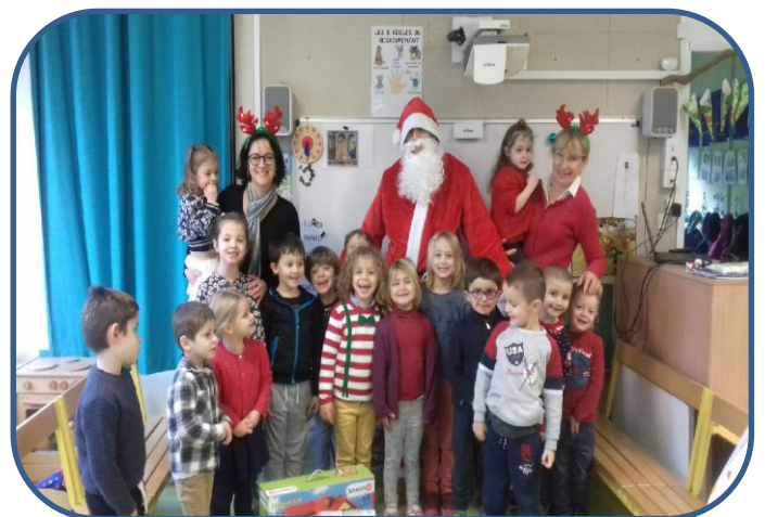
Le Père-Noël dans les classes maternelles