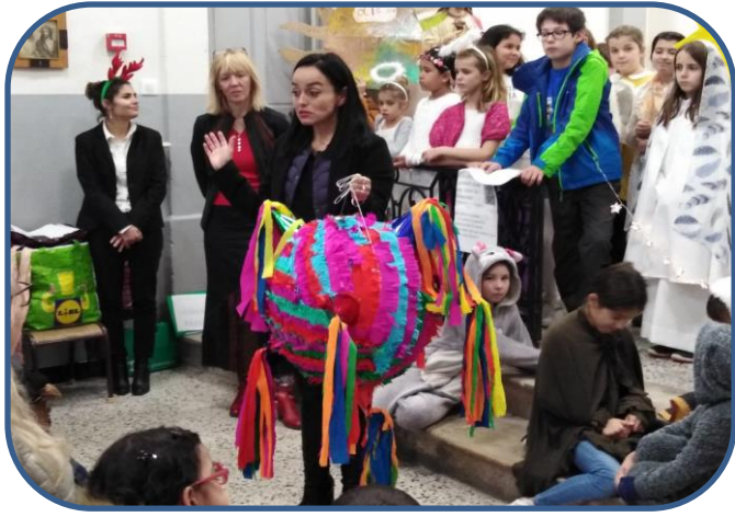
Préparer Noël avec les Collégiens de Jeanne d'Arc