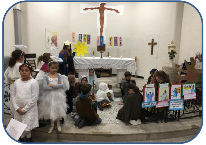
Célébration de Noël