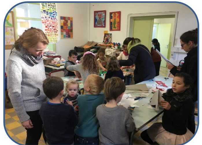
Atelier du mercredi matin (Projet Pop-up)