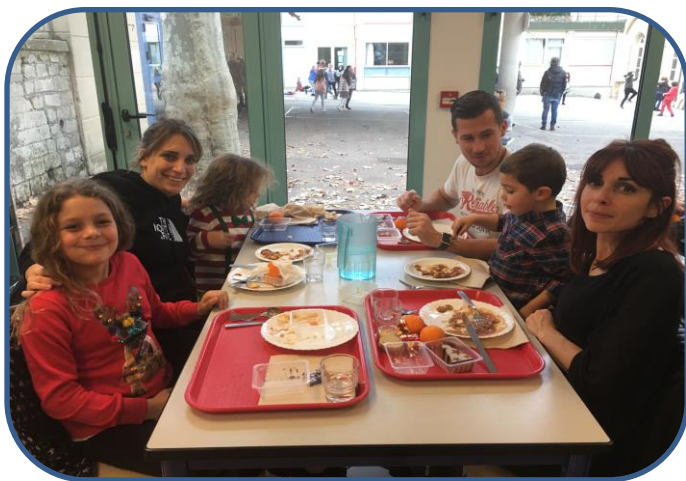
Repas de Noël à l'école